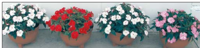
▲ Ízelítő a magyar klímára ajánlott Sonic és Super Sonic Új-Guineai Impatiens-fajtákból