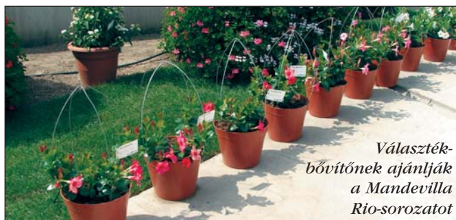
Választék-bővítőnek ajánlják a Mandevilla Rio -sorozatot