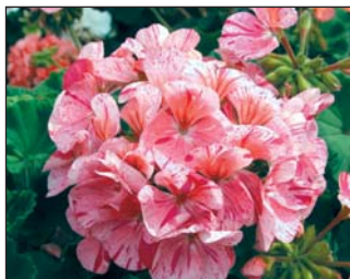
▲ Avenida Mosaic Purple állómuskátli-fajta