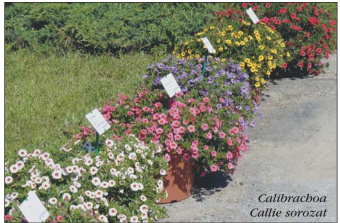
Calibrachoa Callie sorozat

Érdemes megismerkedni ► az Angelonia angustifolia felálló növekedésű, jó hőűrés, egész nyáron át virágzó sorozatával, a Caritával