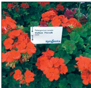
▲ A 2009-es javított Vulkan

A Plant Alliance Kft. muskátlikínálatában is a piros fajták vezetnek, az értékesített mennyiség 60%-a piros, a többi az egyéb színű álló- és futómuskátli-fajta. Az állók közül az eladási listát a Vulkan vezeti, javított vátozatát, az élénkebb színű, nagyobb virágfejű, korai Vulkan 2009 -et is láthattuk. Hasonlóan kiváló, kedvelt a Diabolo . Különleges virágú, alkatában az alapfajhoz hasonlít a hegyes virágszirmú, teltvirágú Graffiti Double Red . Robusztus növekedésű, nem túl helytakarékos, de alacsony hőmérsékleten is jól termesztethető az Americana sorozat. Új szín benne az egyszere-