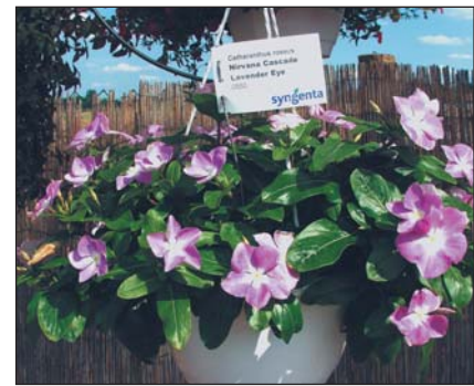
▲ Függőcserépbe való a Nirvana Cascade Cataranthus-sorozat. A képen a Lavender Eye