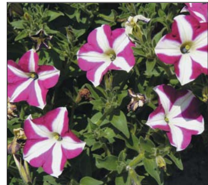
▲ Petunia Cascadia Bicolor Purple futópetúnia

eddig ismert futópetúniáknál két héttel rövidebb idő alatt kész növény nevelhető belőlük.