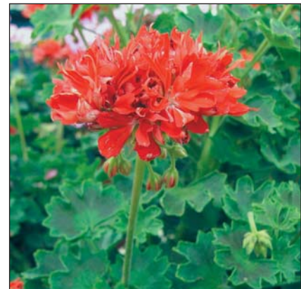
▲ Különleges virágú a Graffity Double Red