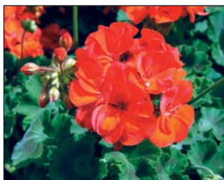
▲ Kedvelt piros a Diabolo

rű fehér virágú, nagy piros szemes White Splash 09 . Egyedülálló a Fischer kínálatában a tört virágszínű, mozaikos fajták, a pirosas Avenida Mosaic Red és a lilás Avenida Mosaic Purple . Intenzív növekedésű, időjárásálló a Rocky Mountain , amiből piros és fehér virágú fajtát kínálnak. Az S&G Flowers muskátlik közül a jól bokrosodó Fidelity I sorozat maradt a szortimentben, hat színnel. Újdonság a lazacszínű, sötét rajzoltos levelű Helena 2009 , amely jó időjárásálló.